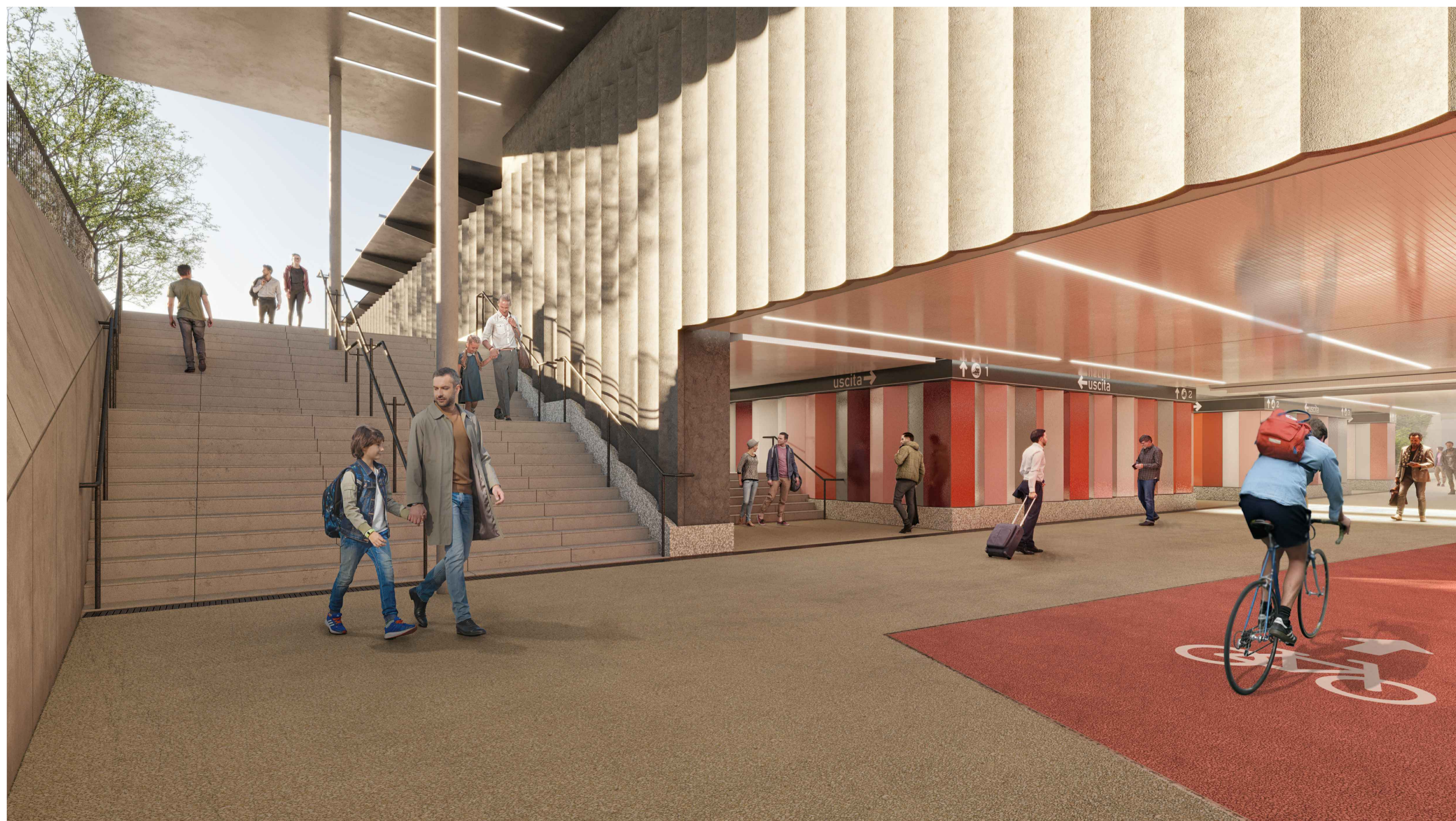
02 RENDER DI PROGETTO - VISTA DEL SOTTOPASSO