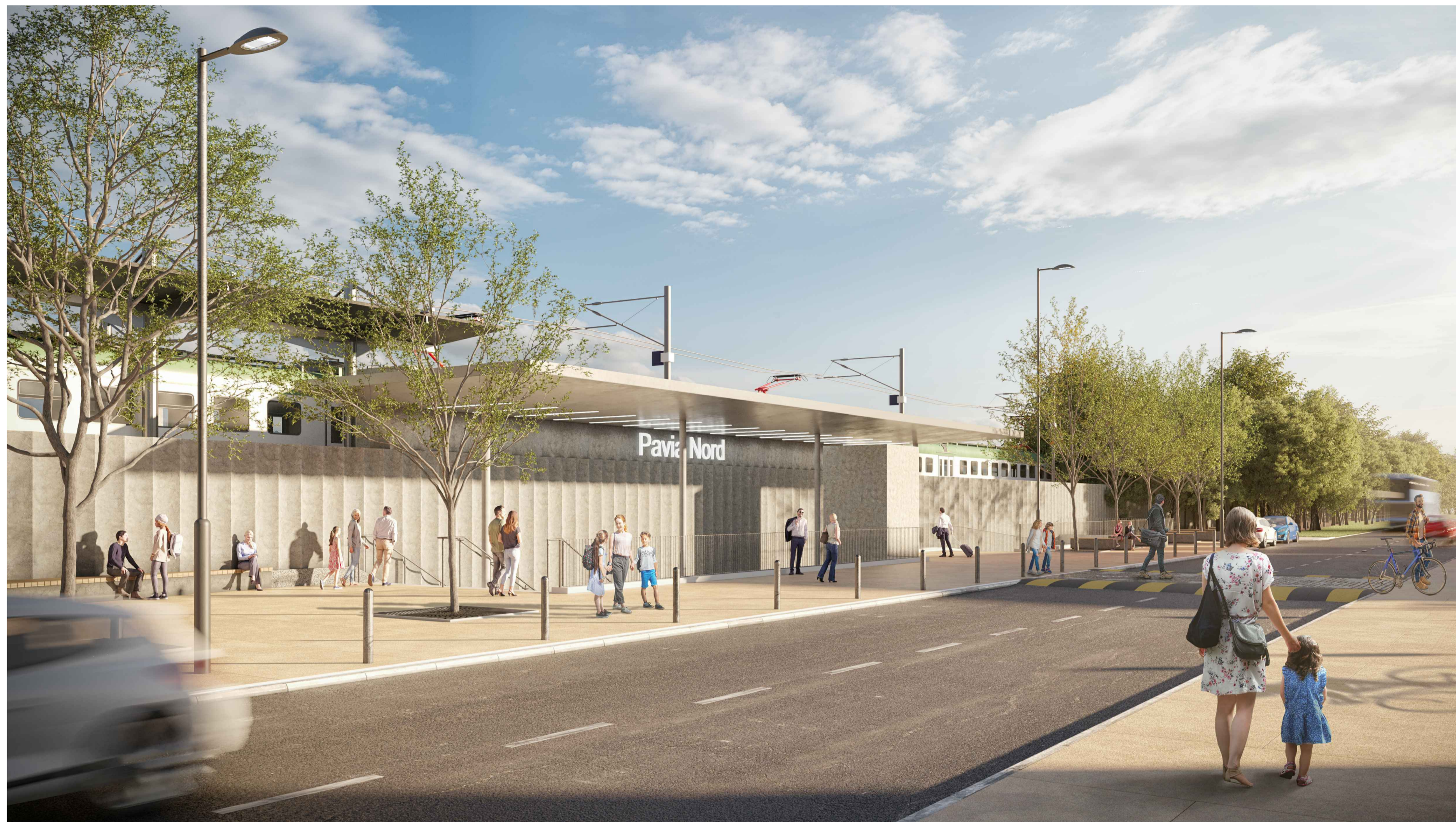
01 RENDER DI PROGETTO - VISTA DA VIA BRAMBILLA