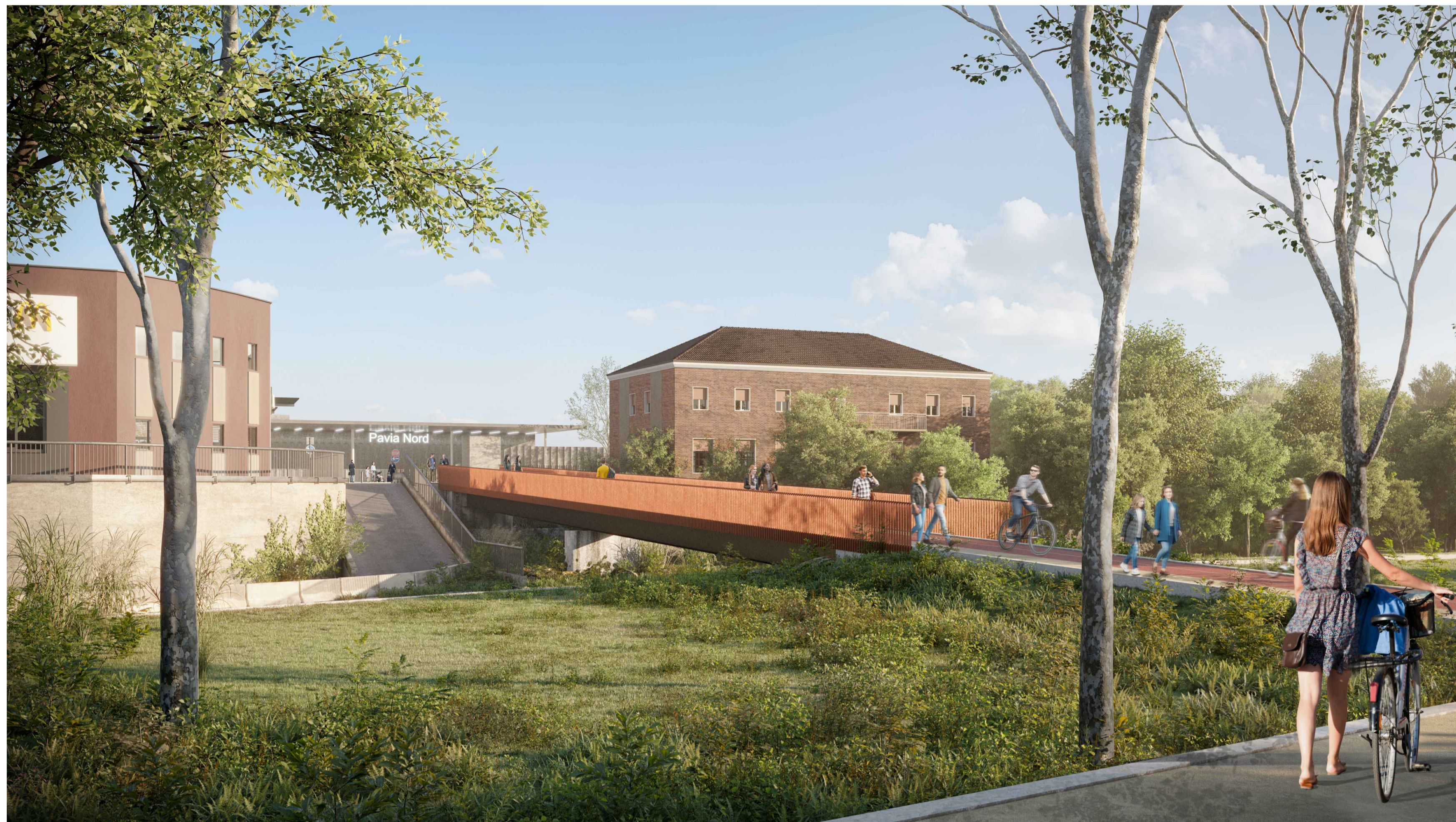
01 RENDER DI PROGETTO - VISTA DA VIA NEGRI ADELCHI