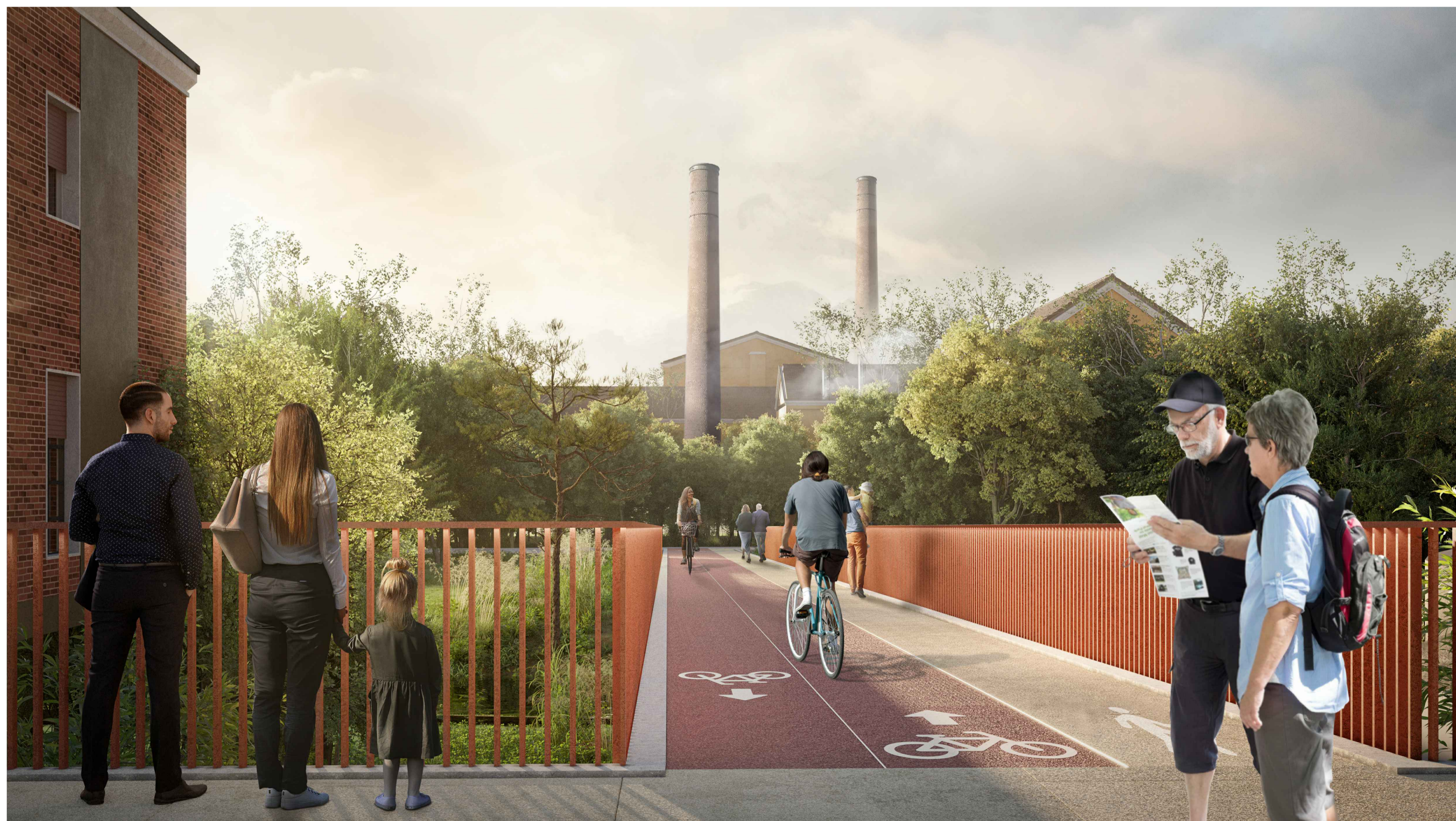
02 RENDER DI PROGETTO - VISTA DA VIA BRAMBILLA