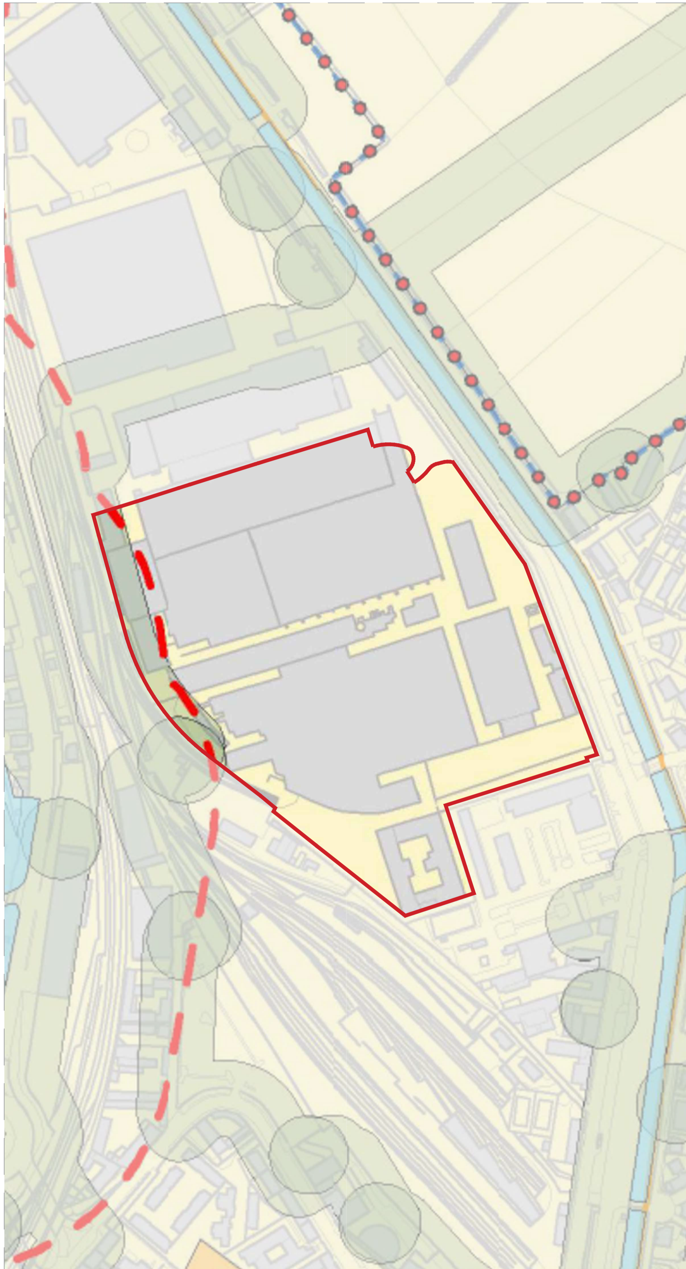
Estratto tav. A10 PDR02a - Carta dei vincoli