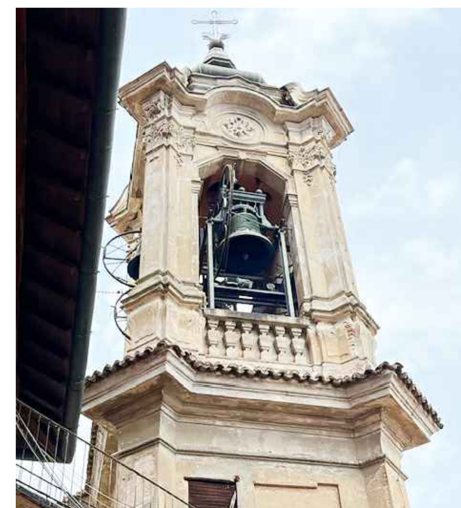
Zoom cella campanaria prospetto sud +22.31 m