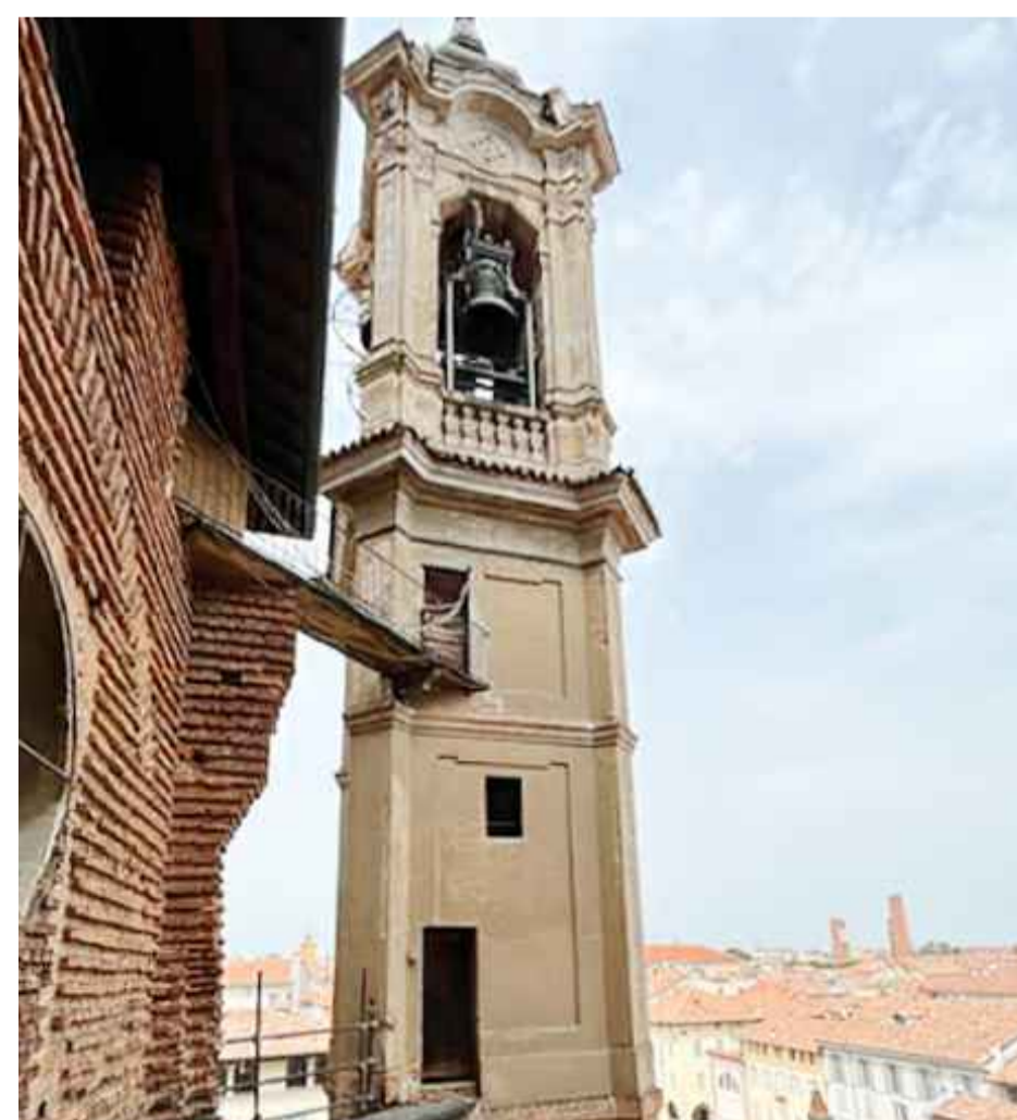
Prospetto sud +22.31 m