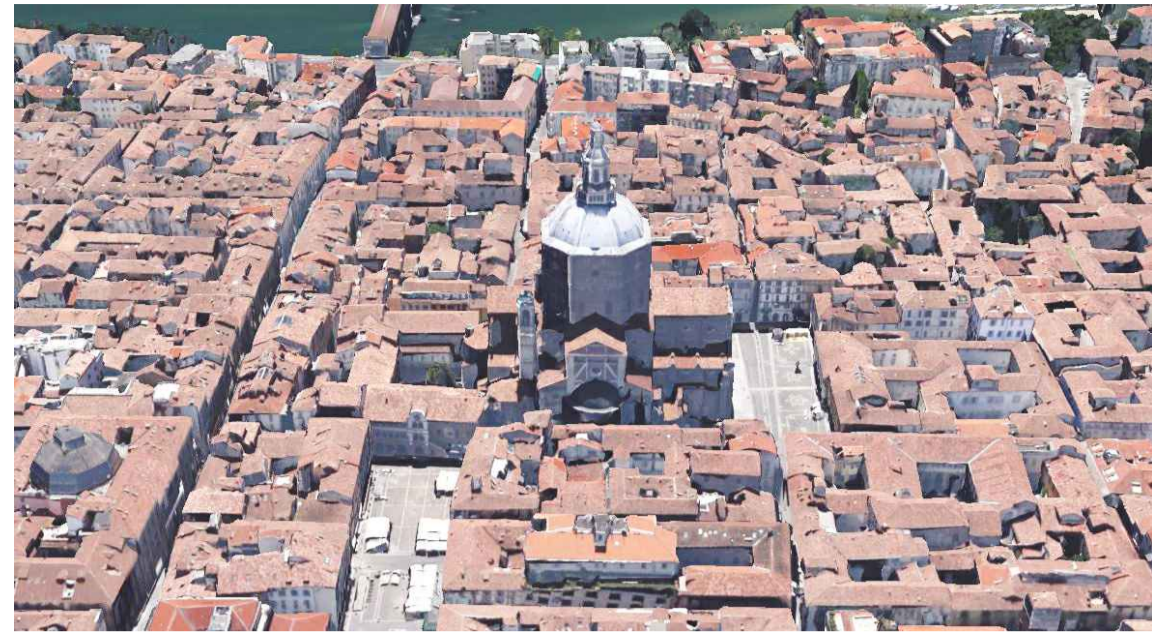
Immagine 1: prospetto nord del Campanile