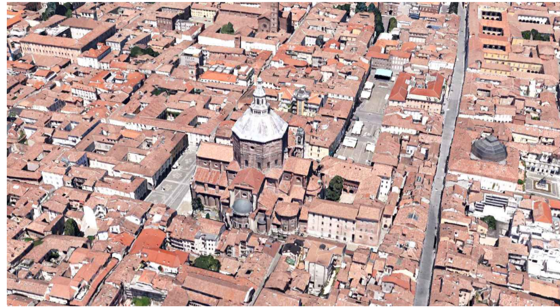
Immagine 3: prospetto sud del Campanile