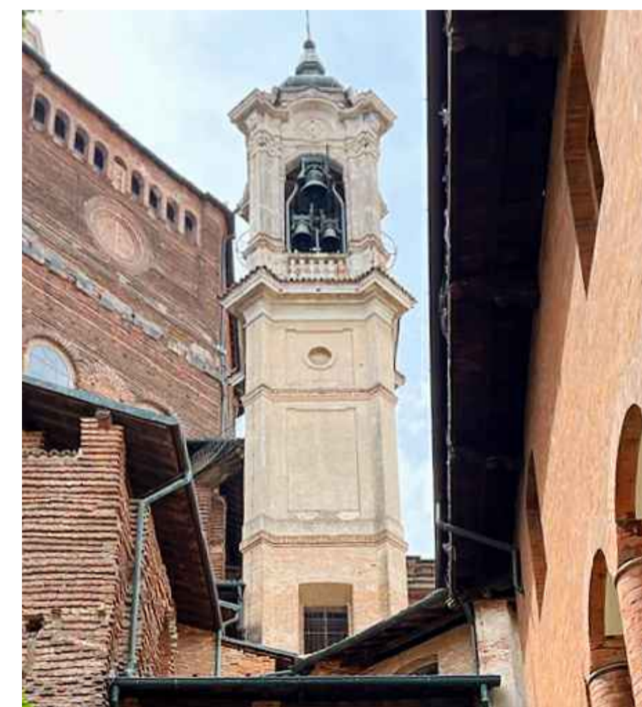
Prospetto est +0.00 m