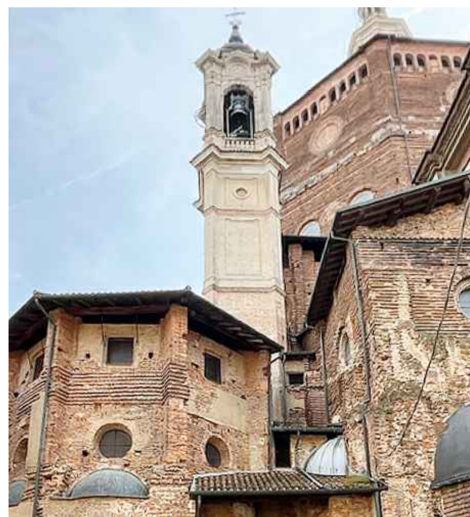
Prospetto nord +0.00 m