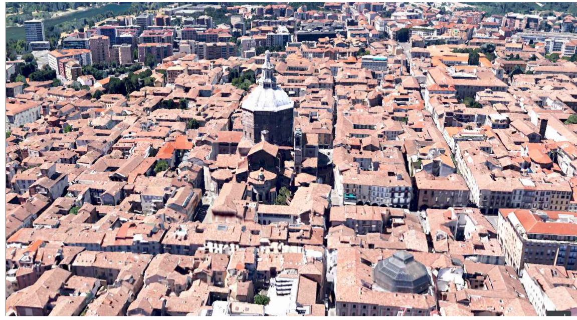
Immagine 2: prospetto est del Campanile