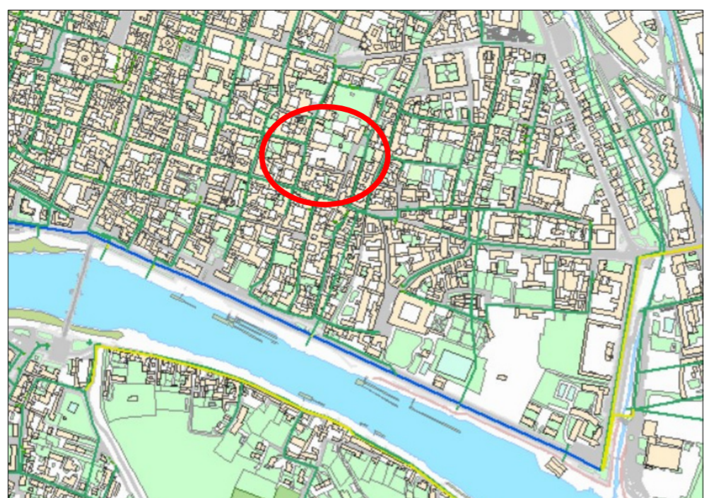
Estratto rete fognatura da P.U.G.S.S. comunale

É fatto obbligo dell'impresa verificare, con gli Enti Gestori, i reali percorsi dei sottoservizi prima di effettuare ogni tipo di lavorazione in sottosuolo