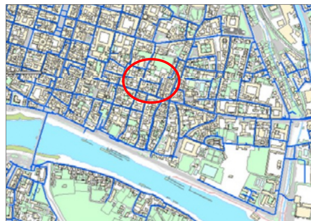
Estratto rete acquedotto da P.U.G.S.S. comunale