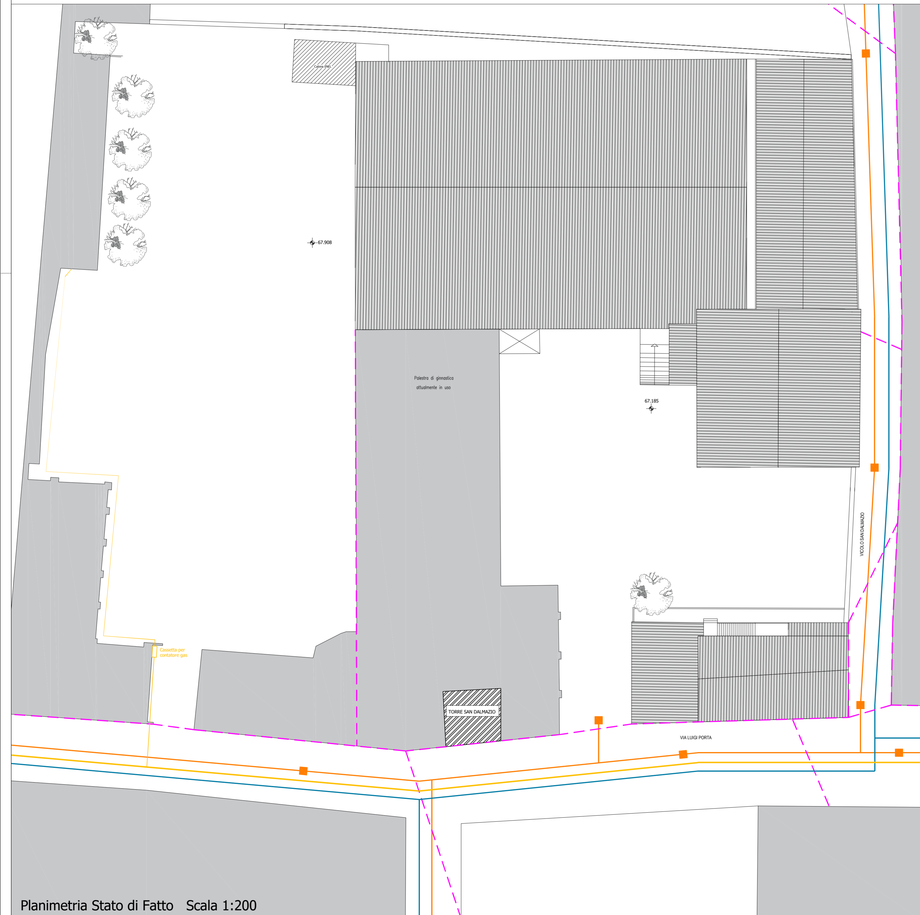
Planimetria Stato di Fatto Scala 1:200