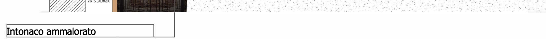
Ricostruzione Fotografica Prospetti stato di fatto