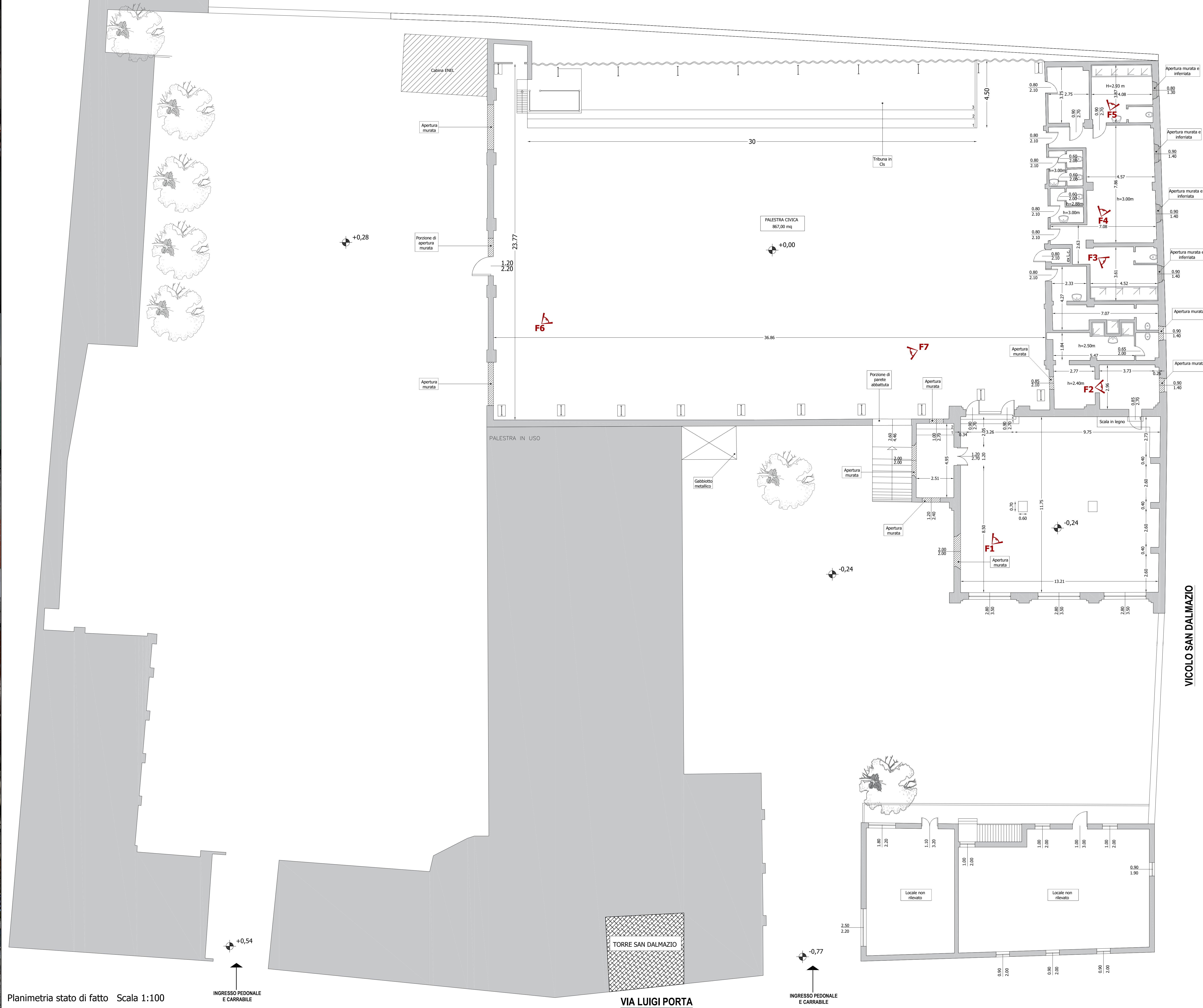
Planimetria stato di fatto Scala 1:100

NOTA: E' obbligo dell'impresa verificare in cantiere tutte le misure del presente progetto con quelle del reale stato dei luoghi;