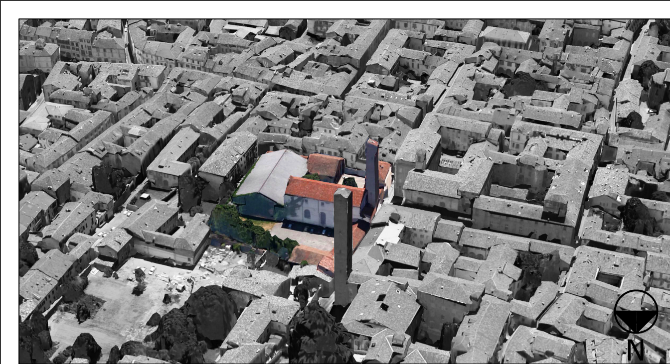
Vista aerea Nord