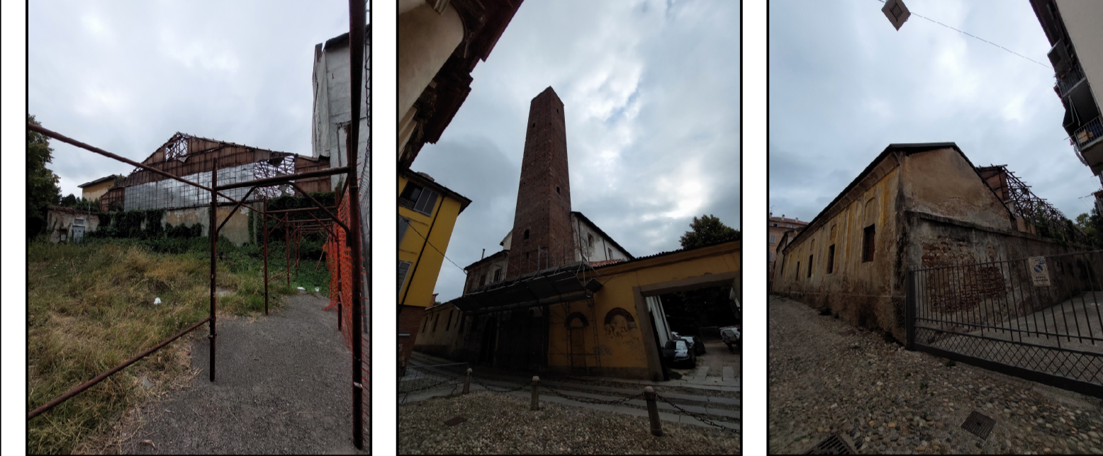
Vista cortile interno