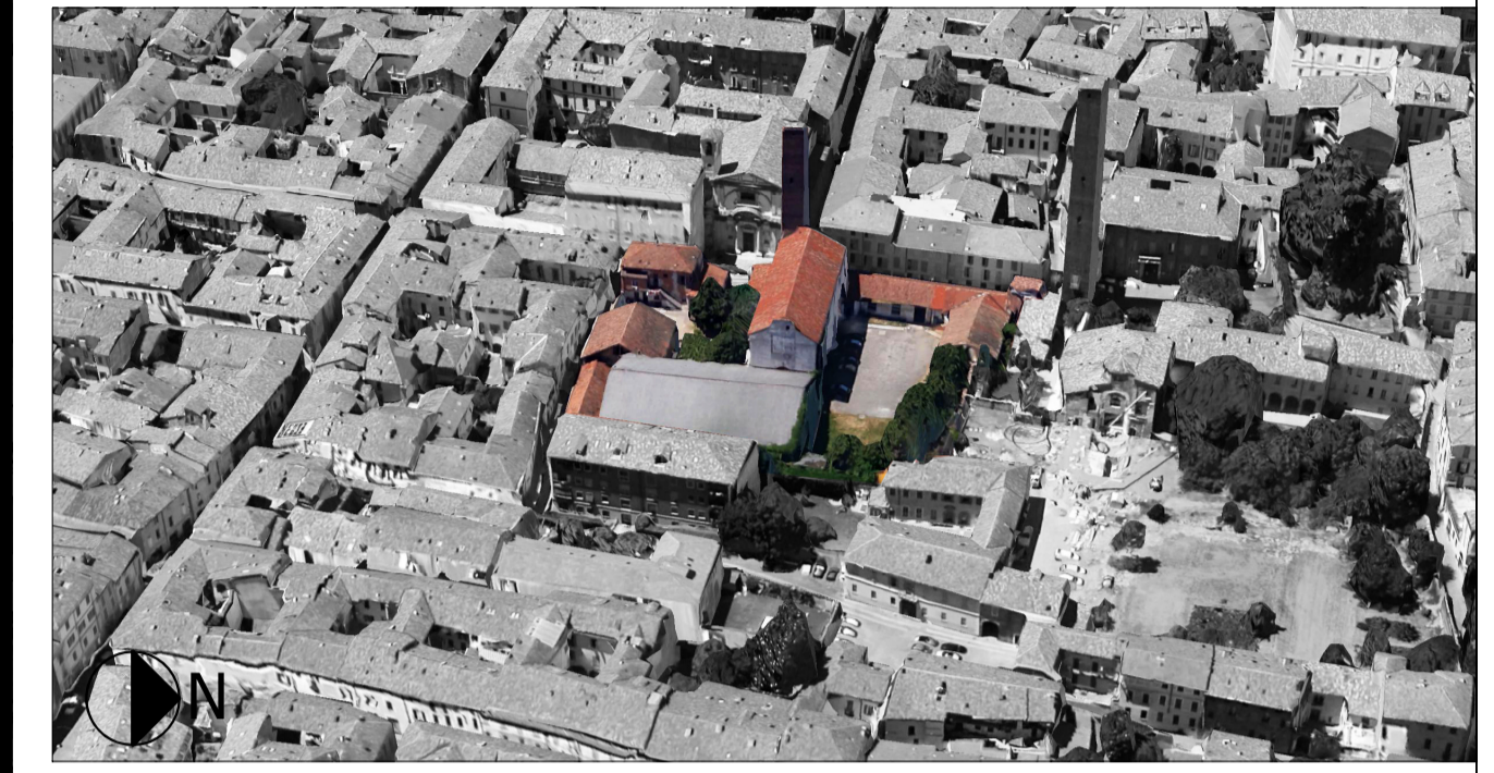
Vista aerea Est