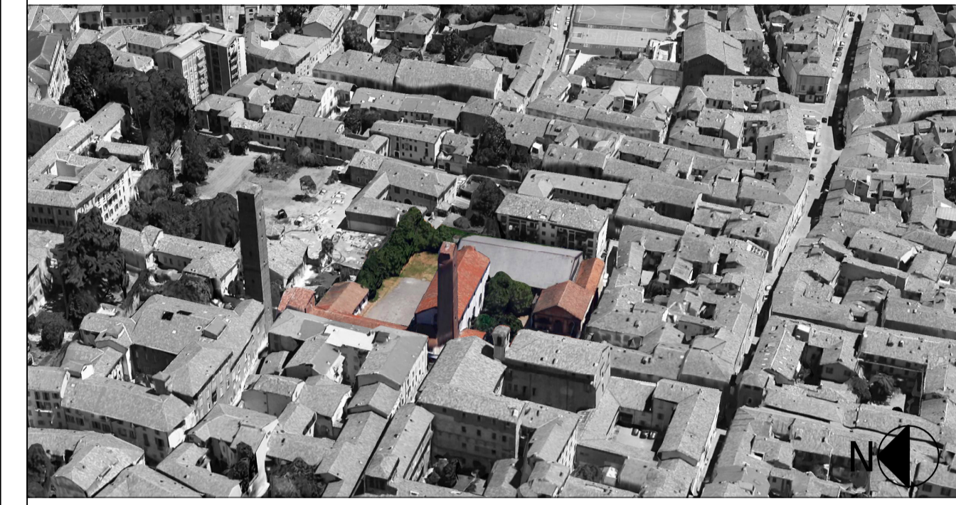
Vista aerea Ovest