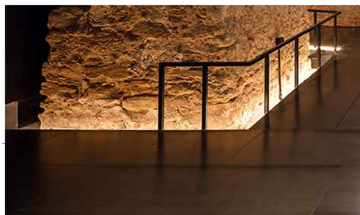
Idea realizzativa gola luminosa con striscia led