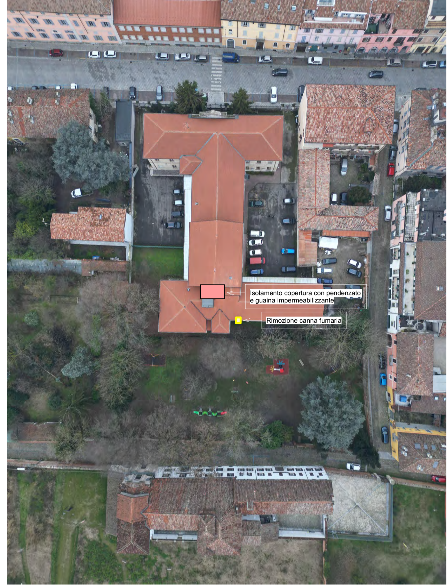
Vista aerea delle coperture: Indicazione degli interventi