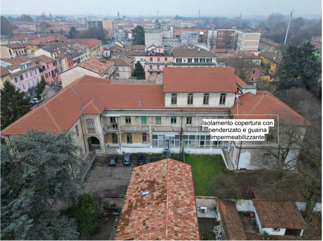
Fronte Ovest: Isolamento e impermeabilizzazione della copertura indicata