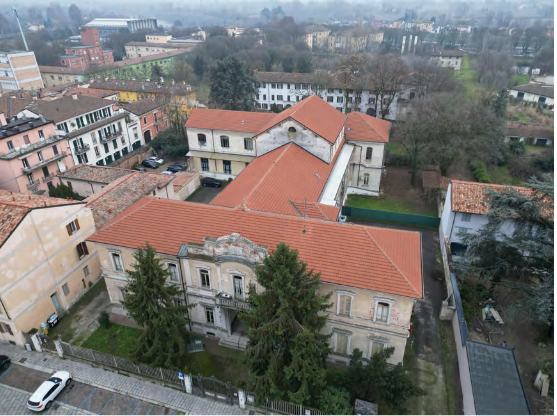
Fronte Nord: non sono previsti interventi di copertura