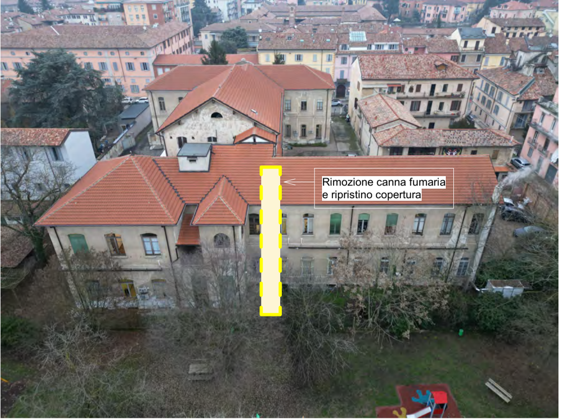
Fronte Sud: Rimozione della canna fumaria indicata