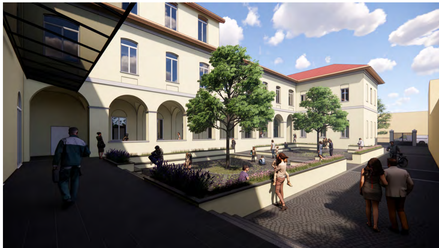
Render 01: Vista Piazza Est