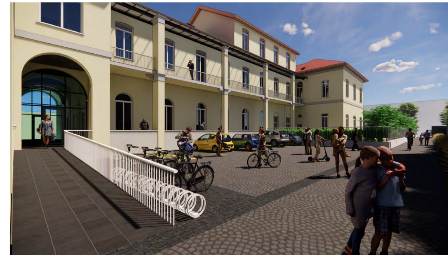
Render 04: Vista Area Esterna Ovest e nuovo collegamento