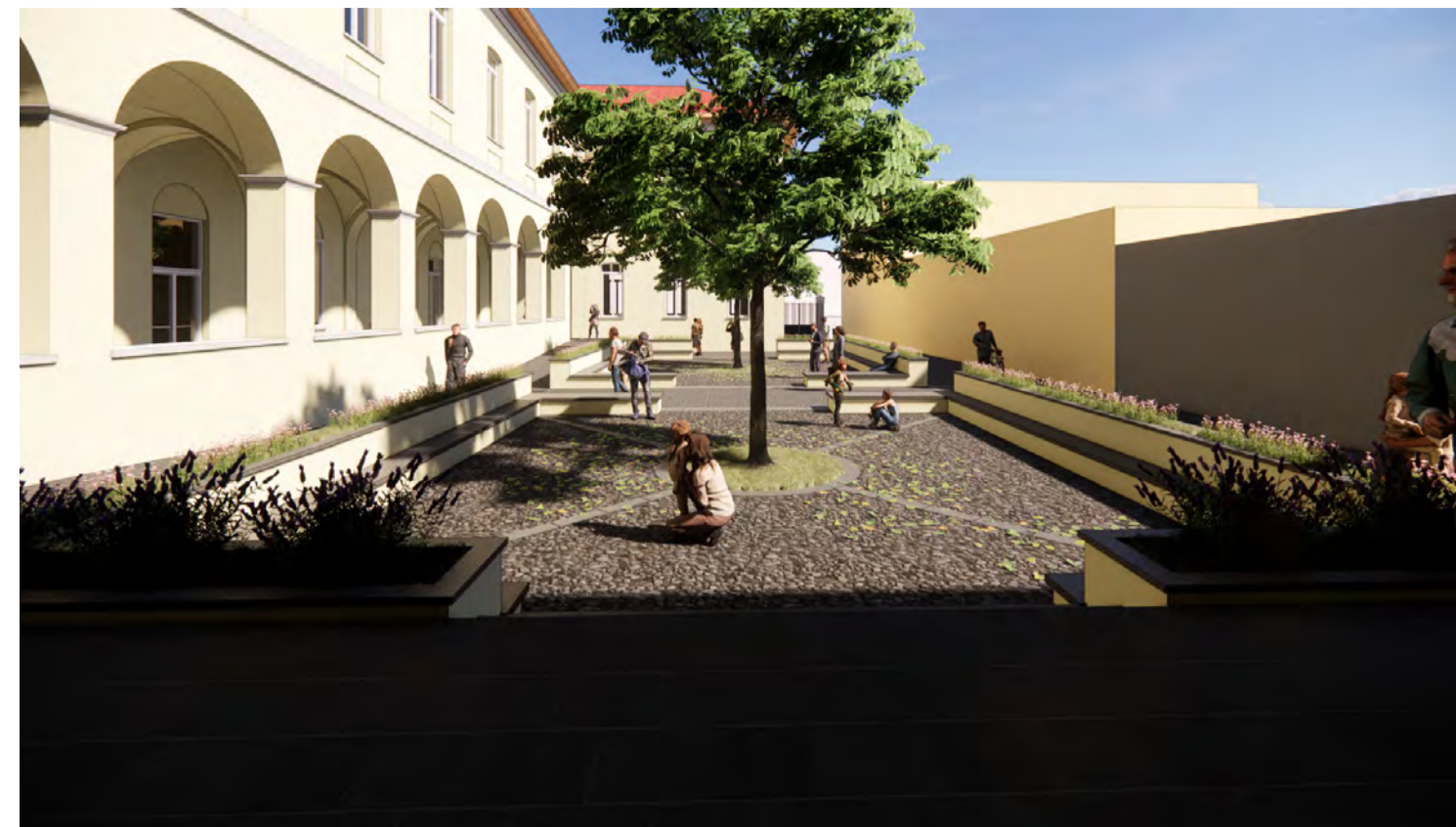
Render 02: Vista Piazza Est