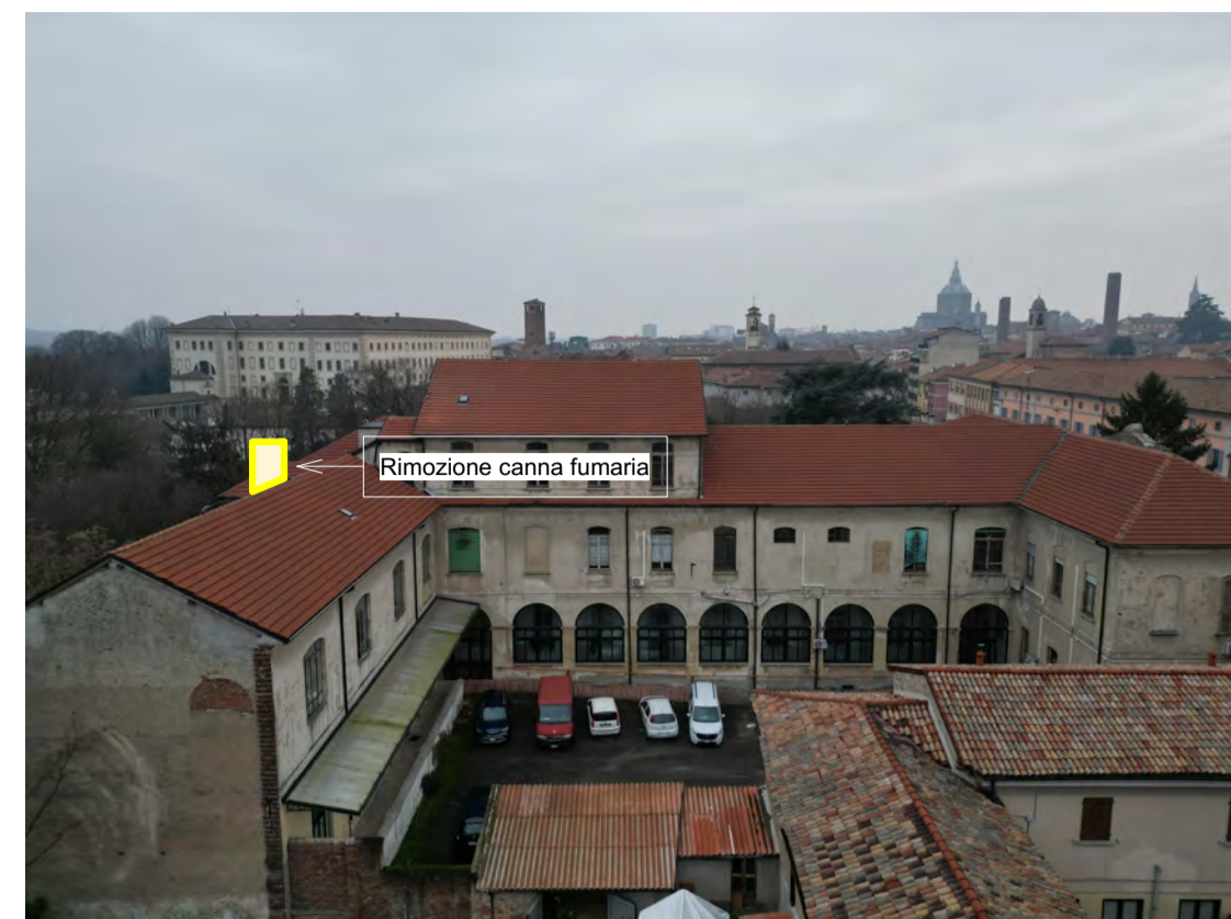
Fronte Est: Rimozione della canna fumaria indicata