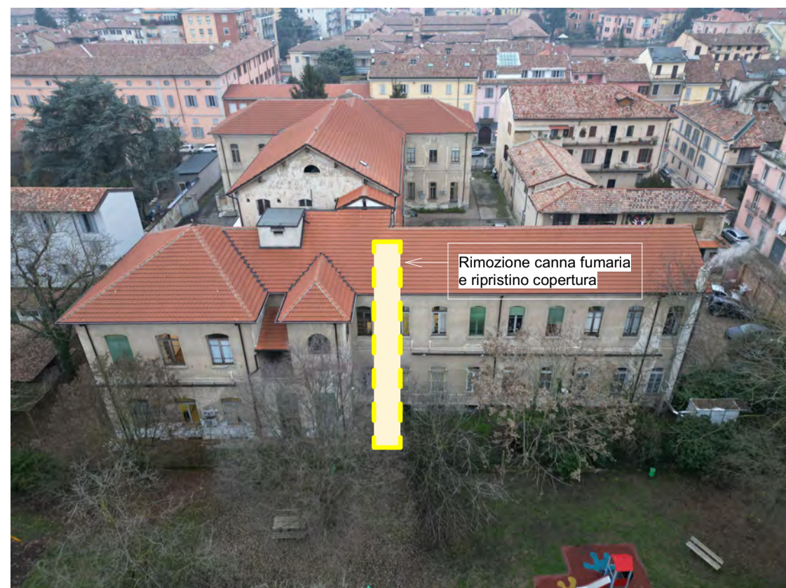
Fronte Sud: Rimozione della canna fumaria indicata