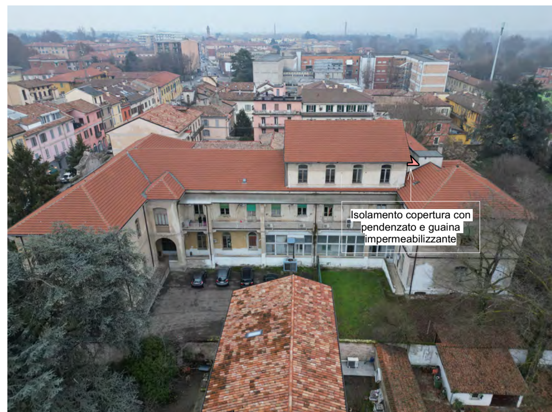
Fronte Ovest: Isolamento e impermeabilizzazione della copertura indicata