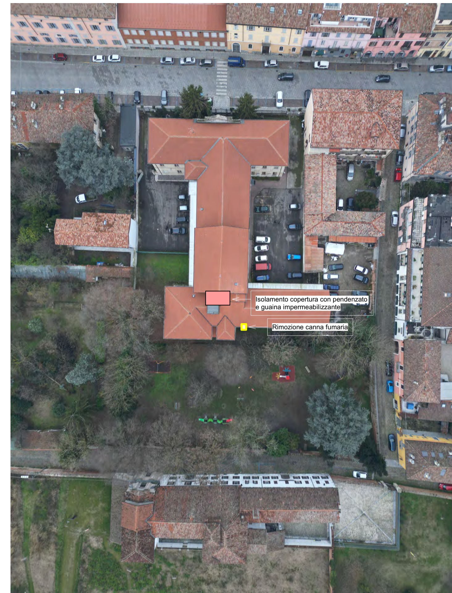
Vista aerea delle coperture: Indicazione degli interventi