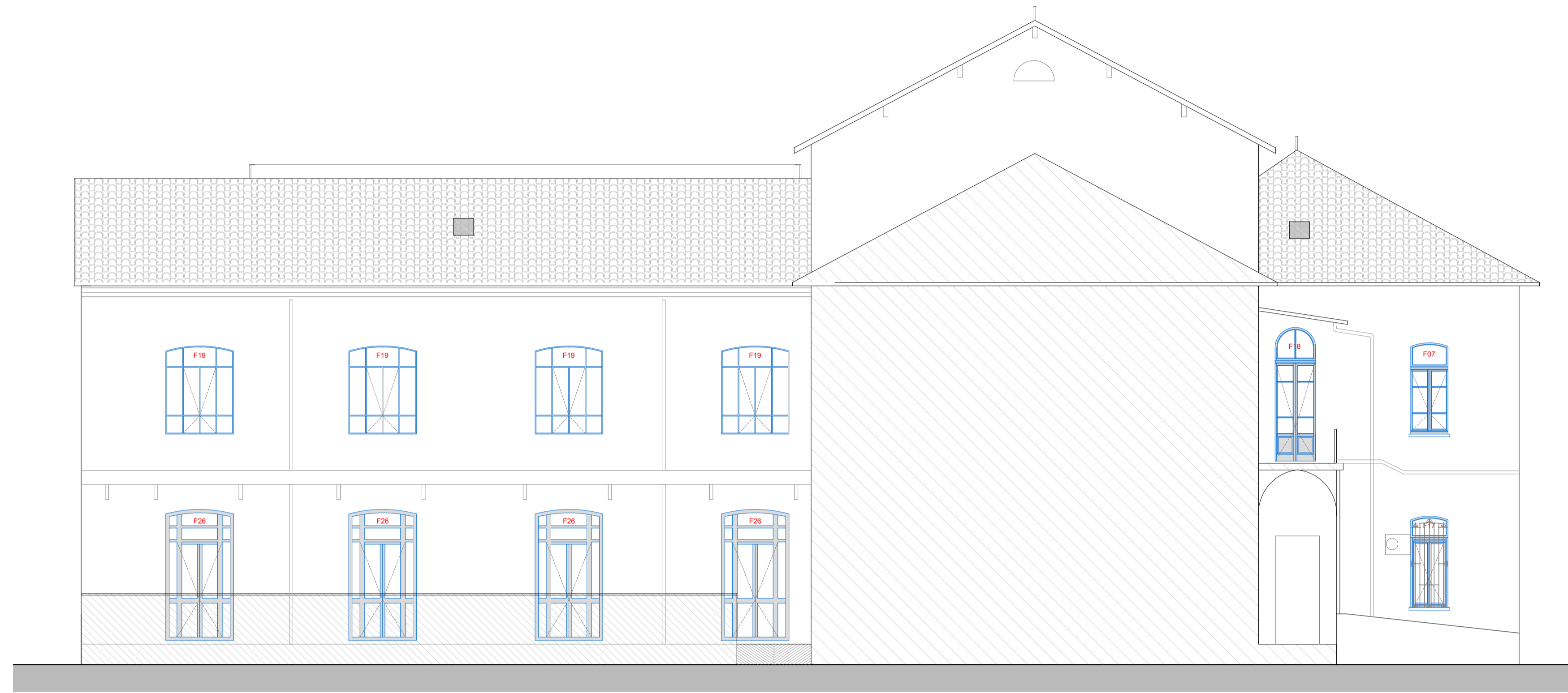
Prospetto Nord (interno)