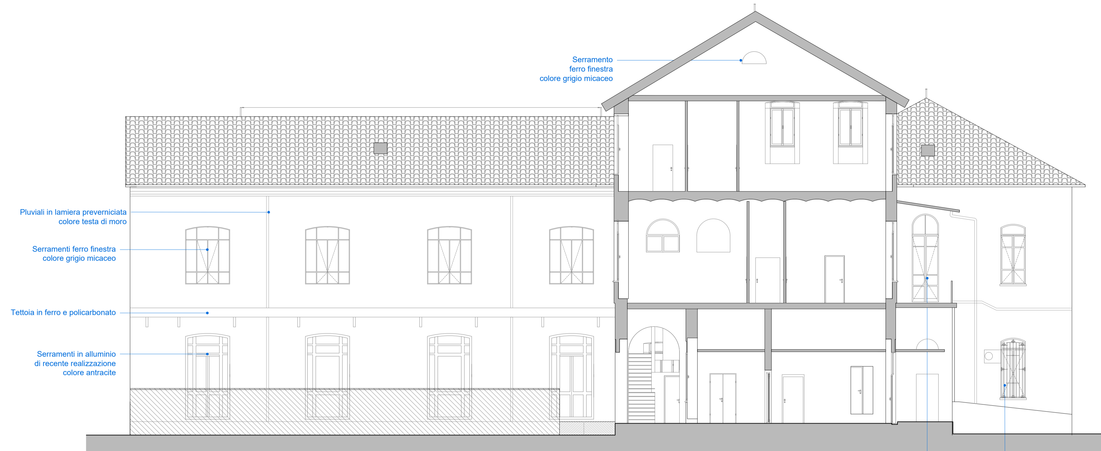
Prospetto Nord (interno)