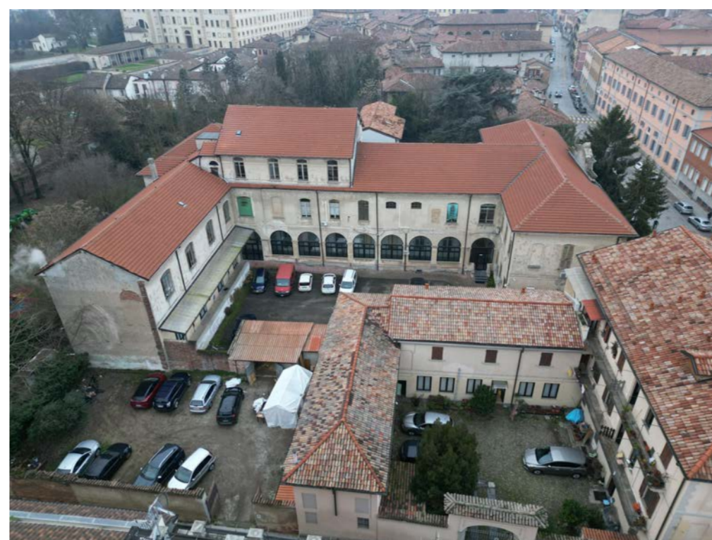
Vista aerea da Via Lotario