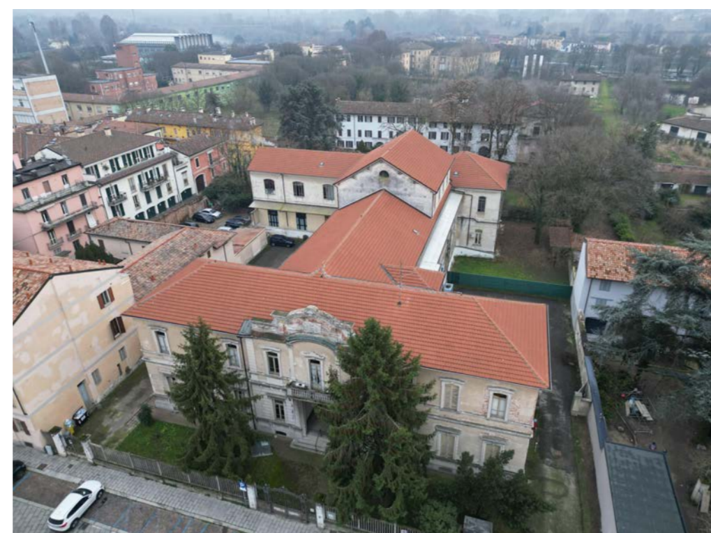
Vista aerea dell'ingresso da Via Garibaldi