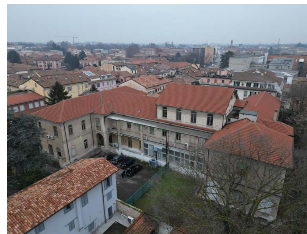
Vista aerea da Via Vercesi