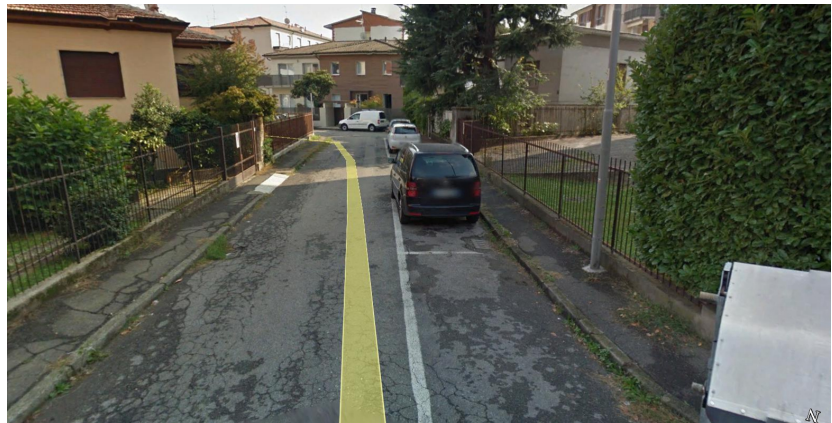
Via Brusaioli