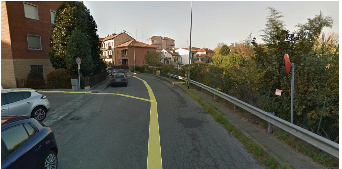
Via Assi San Paolo