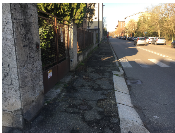
Marciapiedi di Via Folperti lato sud (abitazioni)