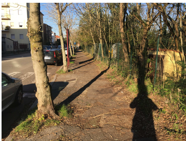
Marciapiedi di Via Folperti lato nord (piscina comunale)