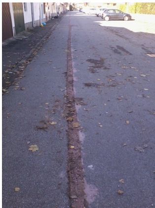
Via Borda Dettaglio