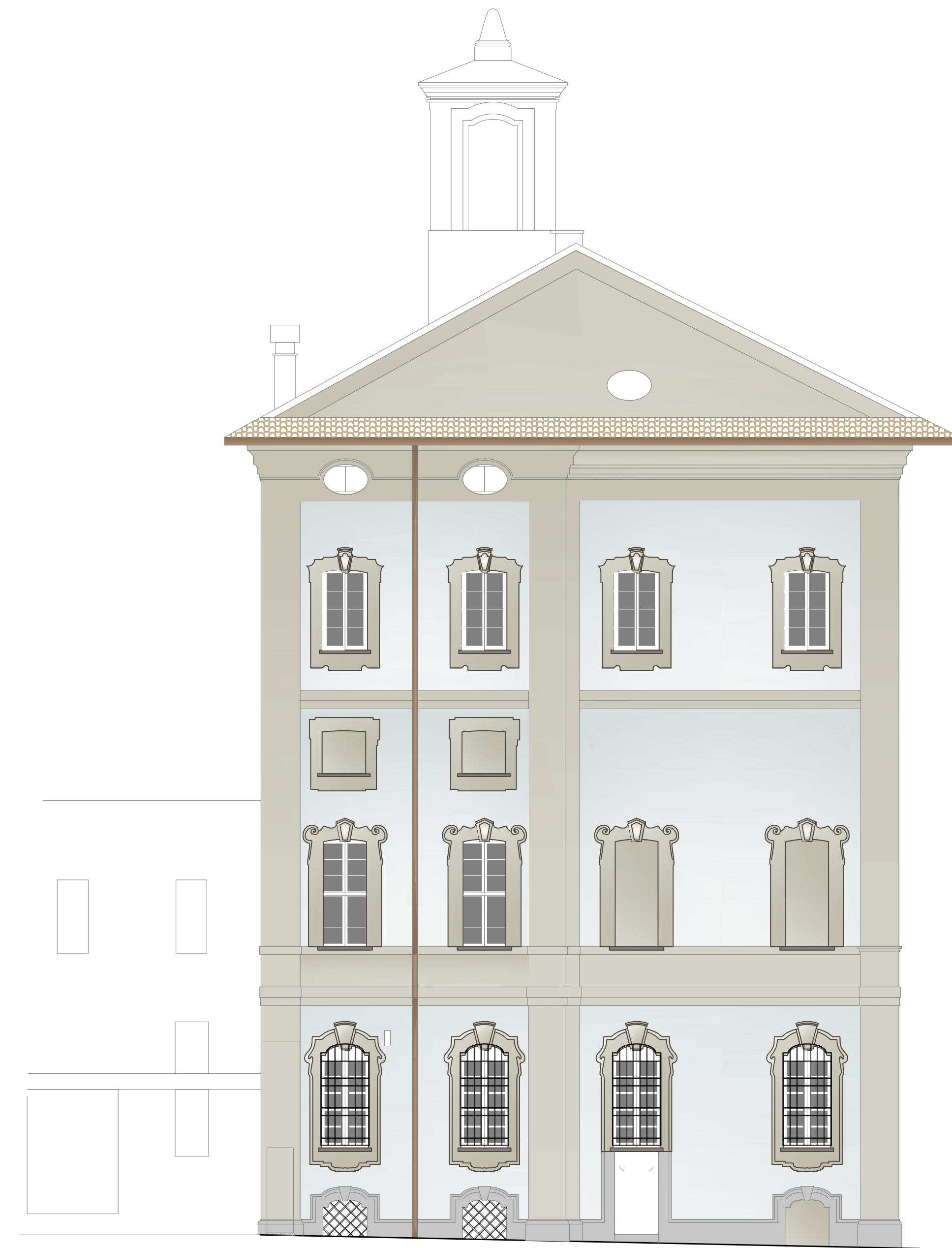
FRONTE LATERALE - via Foro Magno