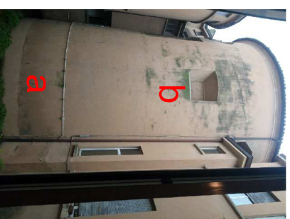
Particolari di dettaglio