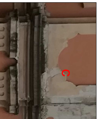
Particolari di dettaglio