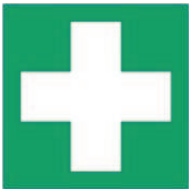
E003 - Pronto soccorso