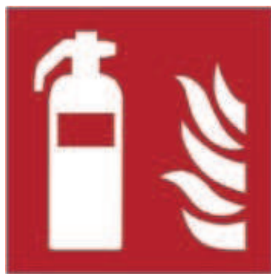
F001 - Estintore