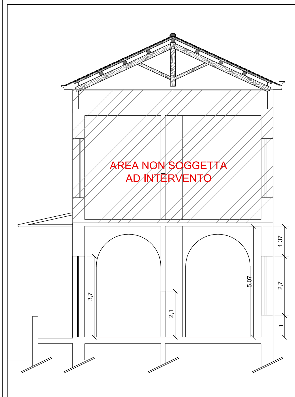
SEZIONE AA - SCALA 1:100