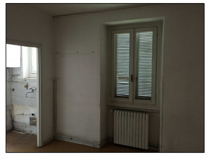
SUB 18 - FOTO 2