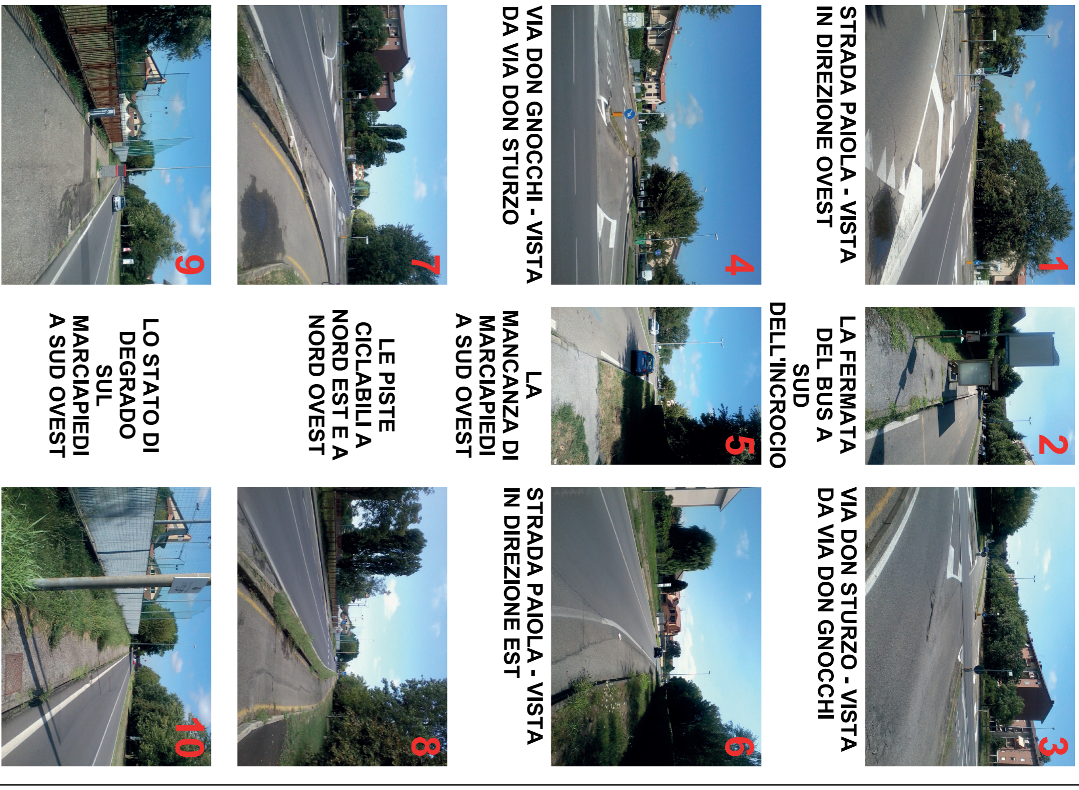
1 STRADA PAIOLA - VISTA IN DIREZIONE OVEST